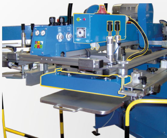
Mod. 1 : Su testa di stampa