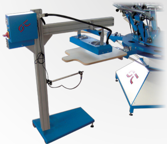
Mod. 3 : Carrellata